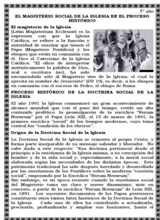
Magisterio de la iglesia católica.